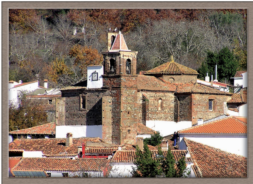
Fig. 1. Vista exterior de la iglesia de Santiago Apóstol de Castaño del Robledo.

La iglesia de Santiago Apóstol de Castaño del Robledo es un edificio de planta de cruz latina formada por una nave con dos tramos rematada en un amplio crucero. En el lado derecho de su cabecera se sitúa la capilla sacramental de planta cuadrada y la casa parroquial y, en el lado izquierdo, la sacristía. Finalmente, a los pies, en el lado derecho del hastial, se localizan la torre y la capilla bautismal de planta rectangular.