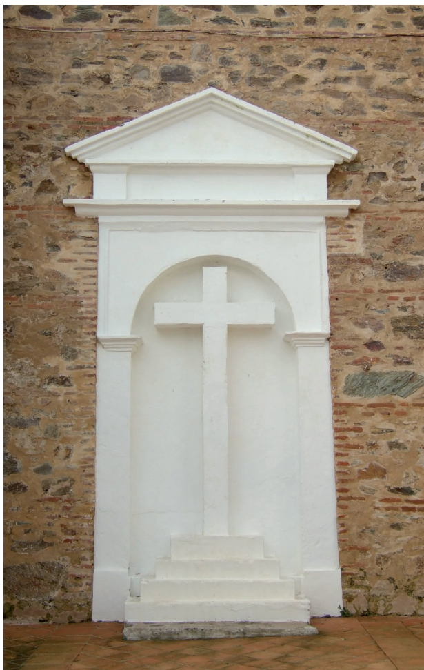
Fig. 3. Puerta del Sol. Inicios del siglo XVII.

Las obras del templo debieron prolongarse quizás hasta alcanzar los primeros años del siglo XVII momento en que se labró su portada lateral, la Puerta del Sol de traza purista y sencillo esquema (Fig. 3). Posteriormente, la gran crisis económica de esta centuria y la inestabilidad política del momento se tradujeron en la interrupción de las obras, de forma que su fachada del hastial quedó inconclusa.