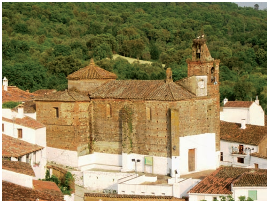
Fig. 2. Vista exterior del muro lateral del templo donde se advierten dos fases de obras de la 2ª mitad del siglo XVI puesta de manifiesto en el cambio de aparejo y en la tipología de las ventanas.

el diseño de los vanos del primer tramo y del que corona la fachada de los pies inspirado, según el citado Alfonso Jiménez, en esquemas del libro IV de Sebastián Serlio. Esta fase podría vincularse con planteamientos del arquitecto Hernán Ruiz II quien, desde 1562, daba trazas en los templos de la comarca como Maestro Mayor de obras del Arzobispado de Sevilla 7 .