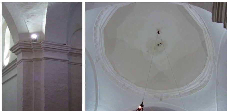
Fig. 6. Crucero del templo. Detalles de los pilares y de la media naranja. 1716-23.

Finalmente, en 1723 se terminó de labrar el crucero, amplio espacio constituido, como indicamos líneas arriba, por cuatro fuertes pilares de orden toscano sosteniendo la media naranja sobre pechinas del crucero y las bóvedas de cañón con lunetos de sus brazos (Fig. 6). También en estos momentos se labró una nueva sacristía y un cuarto para pósito 20 .