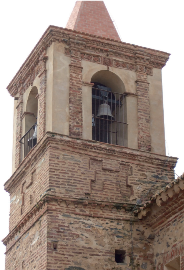
Fig. 5. Detalle del cuerpo de campanas de la torre. En su construcción intervino el maestro Alonso Yáñez Romero entre 1696 y 1698.

También por estos años se edificó a los pies de la nave una tribuna para el coro, recogiendo las cuentas del año 1694 los pagos de las maderas de su estructura –vigas y tablas-, así como los sueldos de los carpinteros y alarifes que intervinieron en el proceso: ...costó la madera, viga y cuarterones para el coro alto 379 reales y medio; de la hechura de carpinteros del dicho coro 350 reales; de la manufactura de albañil para el coro y escalera, 125 reales.... 12