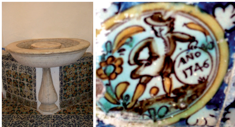
Fig. 4. Pila bautismal labrada en 1694 por mandato del Arzobispo Palafox. Incluye un zócalo de azulejos sevillanos de tipo Delf datados en 1746.

Las obras de la torre debieron comenzar también en la última década de este siglo XVII, aunque el momento álgido de su proceso constructivo se produjo entre los años 1696 y 1698, cuando las cuentas de fábrica recogen los pagos a los distintos maestros y peones que intervinieron en su construcción, junto a otros diferentes gastos de ladrillos, guarniciones de cantería, remates de forja y asiento de las campanas 11 .