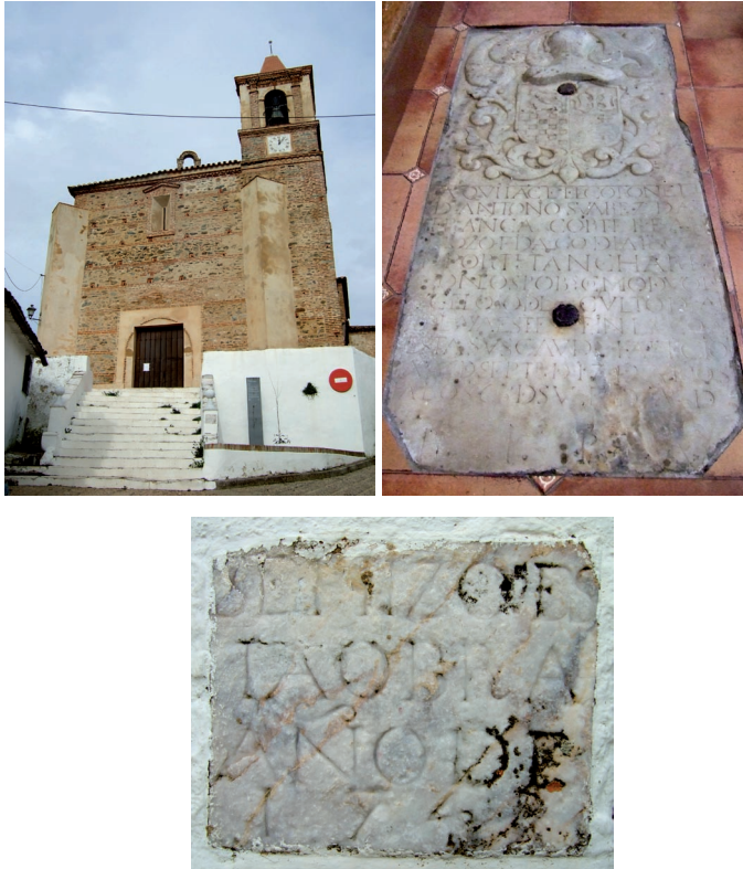
Fig. 7. Escalera de acceso al templo. Año 1743. Costeada por legado testamentario de don Antonio Suarez Da Franca, hidalgo de origen portugués vecino del Castaño.

Años después, en 1743, Antonio Suárez da Franca 21 , hidalgo de ascendencia portuguesa vecino de la villa, dejó por cláusula testamentaria cierto montante económico para la parroquia, dinero que se empleó en hacer un nuevo órgano y labrar una escalinata que salvara el desnivel entre la actual calle Iglesia y la plataforma del templo (Fig. 7).